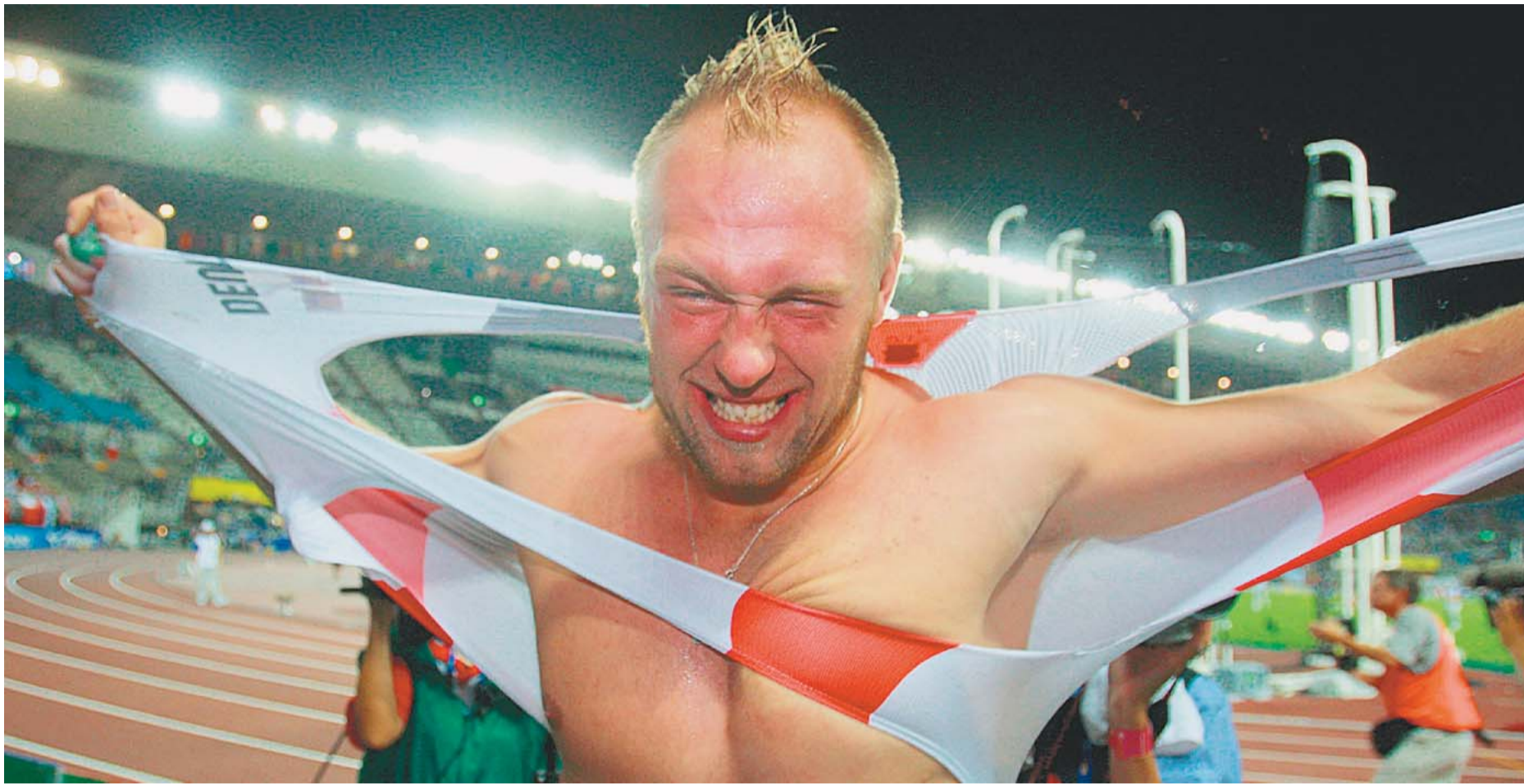
Zerreißprobe eines Athleten mit Ecken und Kanten: Diskuswerfer Robert Harting