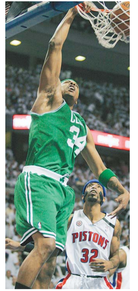
Boston ist im Aufschwung.

Garnett zeigt inzwischen, dass er mit dem auf ihm lastenden Druck fertig wird. Vor dem entscheidenden Spiel gegen Atlanta war er so nervös, dass er 24 Stunden lang nicht schlafen konnte. „Er weiß, um was es geht“, meinte Mannschaftskollege P. J. Brown. „Er weiß, dass es in dieser Liga nur wenige Gelegenheiten gibt, um Meister zu werden. Und davon träumt er. Tag und Nacht.“ Die 22 Punkte belegen, dass es nicht beim Träumen bleiben muss. JÜRGEN KALWA